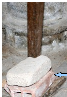
Calage d'une patte de table à côté du confessionnal 75%

(2) Laissez la route du cimetière sur votre gauche,