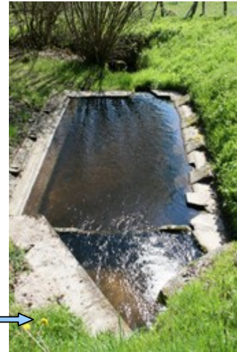
Lavoir 1 – sortie village avec 4 pierres à laver

(15) Quittez La Serre, rejoignez la D78 tournez à gauche, suivez la sur 50 m environ, (16) prenez le petit « cheminet » sur la droite dans le bois