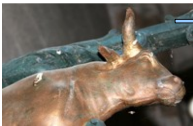
dans l'église 75%