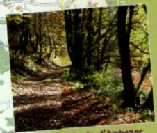
Chemin des Monts d'Ambazac