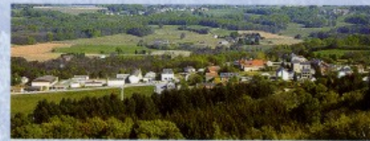
Vue panoramique depuis la Pierre du Roy.

À l'angle sud des antennes, le chemin traverse une lande de bruyères et de fougères en longeant la forêt. Descendre sur 300 m puis prendre à droite. Vue sur le carrefour du col de la Roche. Descendre par un chemin, parfois humide, qui rejoint la route au col de la Roche (456 m). Traverser la D 914 en direction de Saint-Sulpice-Laurière. Les promeneurs fatigués peuvent rejoindre directement leur point de départ en traversant Saint-Sulpice-Laurière. Pour les plus courageux, il reste encore une belle promenade à travers la forêt. Prendre à gauche en direction du Maillorat. La route monte sur 200 m environ. Prendre le chemin forestier sur la droite et suivre sur 800 m jusqu'à un virage goudronné très accentué. Dans le virage, prendre à droite un chemin qui traverse la forêt sur 1,5 km environ et rejoint Saint-Sulpice-Laurière au lieu-dit «La Pissarote» à cause des nombreuses sources qui s'y rejoignent. Vous êtes alors à 25 m de votre point de départ : le lavoir de Cressac.